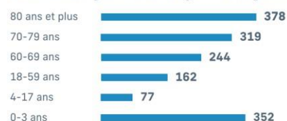
Déclinaison par classe d'âge – Taux pour 1000 habitants